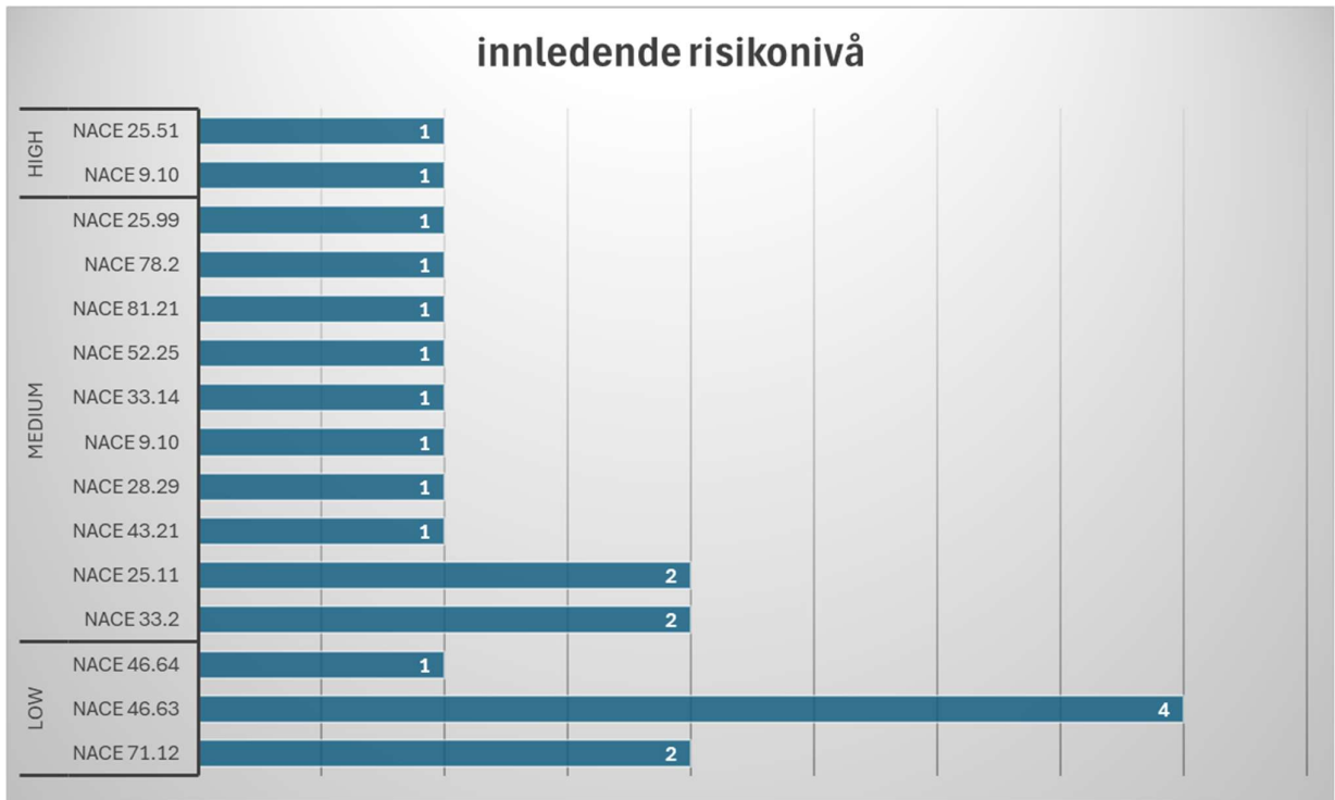
Figur 2: Antall leverandører (innledende risikonivå) basert på NACE kode - bransje /industri (EBRD)