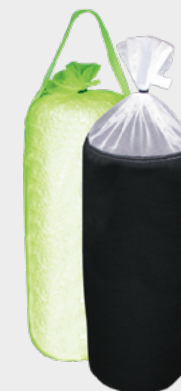
Implementazione di un NUOVO elemento filtrante verde JORC di alta qualità