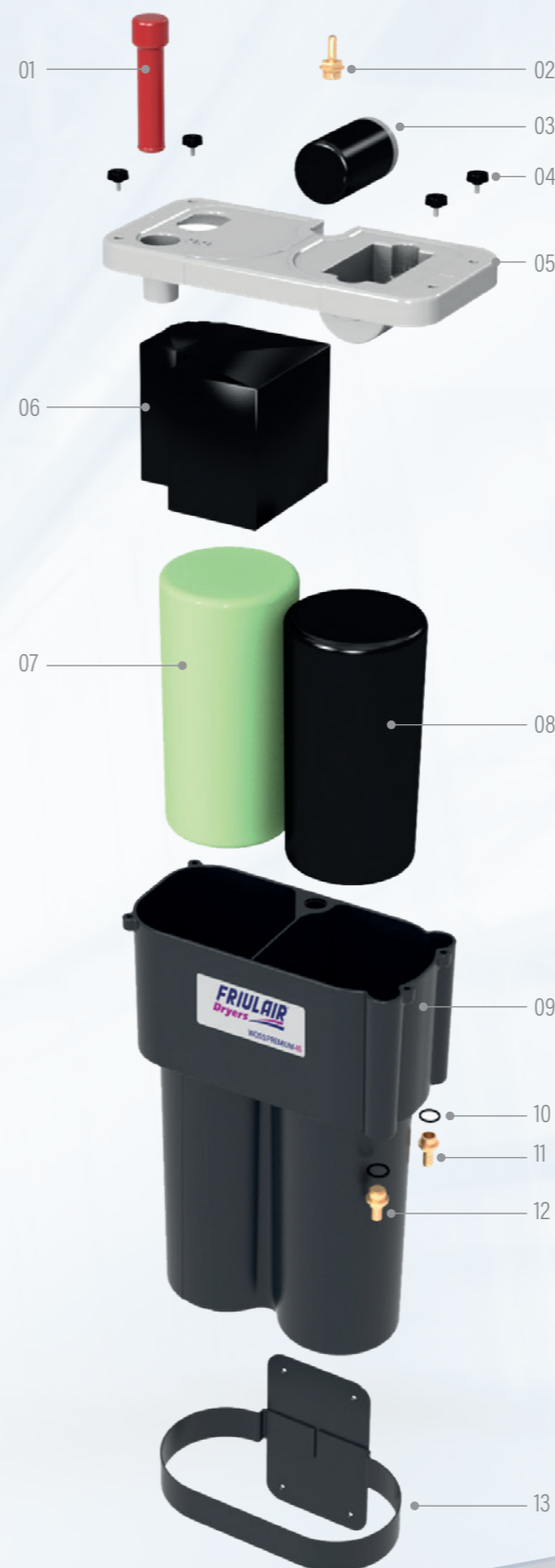
Leggenda della vista esplosa di / Legend of the exploded view of WOSS PREMIUM 45

EN: Each of these WOSS PREMIUM separator models is designed with a focus on environmental regulations, operational efficiency, and ease of use, ensuring optimal solutions for diverse compressed air treatment needs.