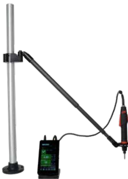
Ramię teleskopowe z włókna węglowego