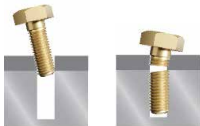
Niewspółosiowość Uszkodzona śruba