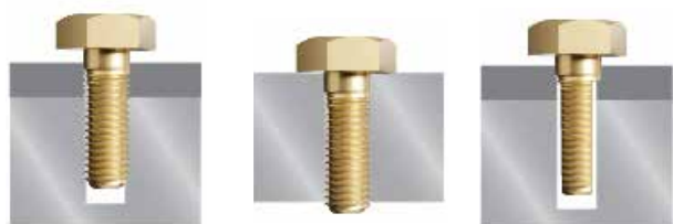
Pływające dokręcanie Brakująca część Uszkodzony gwint

Korzyść: Operatorzy mogą wykrywać i zapobiegać typowym błędom dokręcania w czasie rzeczywistym, redukując czasochłonne przeróbki i koszty jakości.